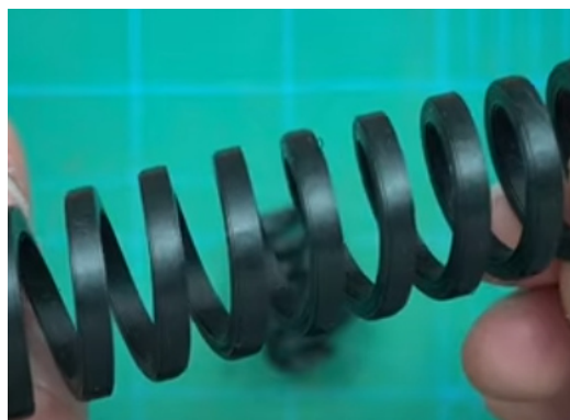
Рис.1.Образец и модель изделия «Пружина»

Габаритные размеры изделия: не более 50 ×15 мм, не менее 35 × 8 мм.